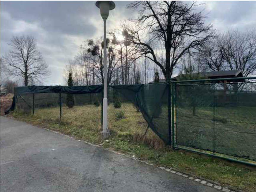
FOTO STÁVAJÍCÍ BRÁNY NA PARC. Č. 5123/4